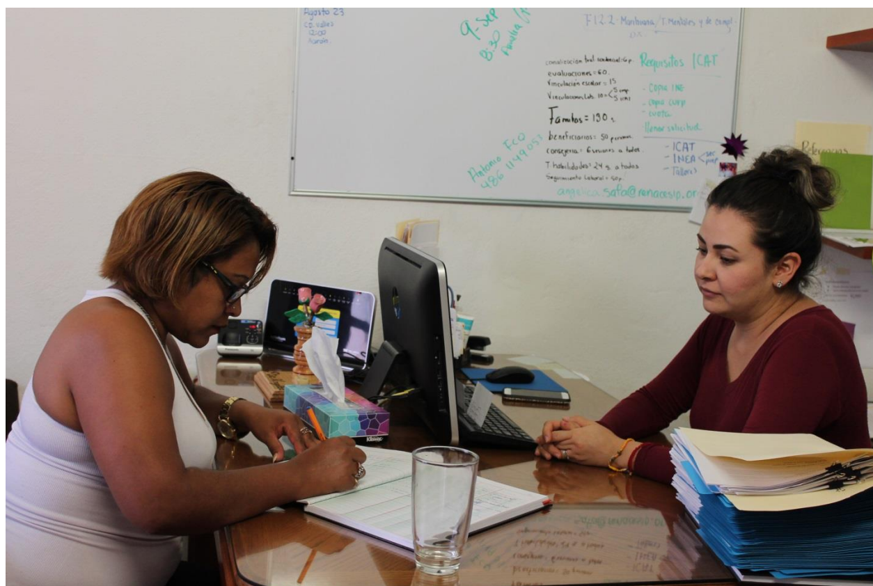
Unidad de Reinserción de Renace realizando terapia individual a beneficiaria directa por defensa jurídica. 2018