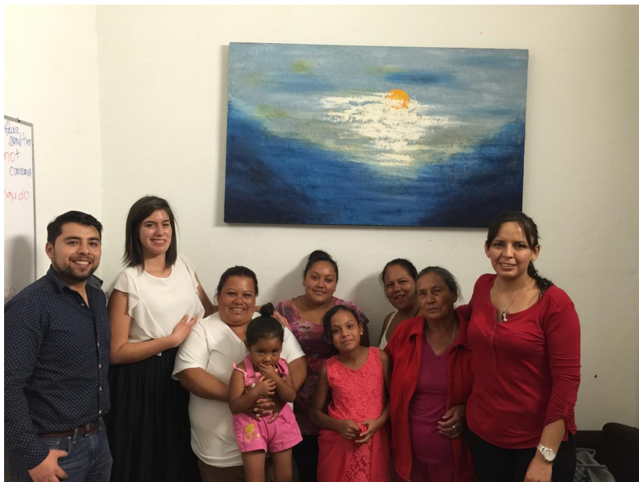
Libertad a beneficiaria, bajo defensa jurídica de Renace. Reunión con su familia y equipo