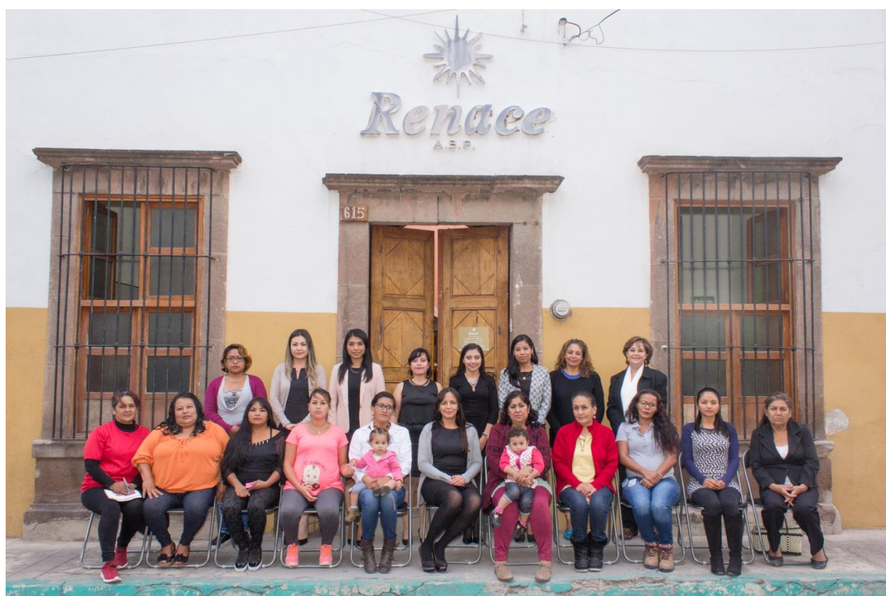
Equipos de Unidad Jurídica, Unidad de Reinserción, Unidad de Control y Vigilancia, Unidad de Proyectos y Comunicación Social, y Consejera con algunas de las beneficiarias directas de Renace. 2018