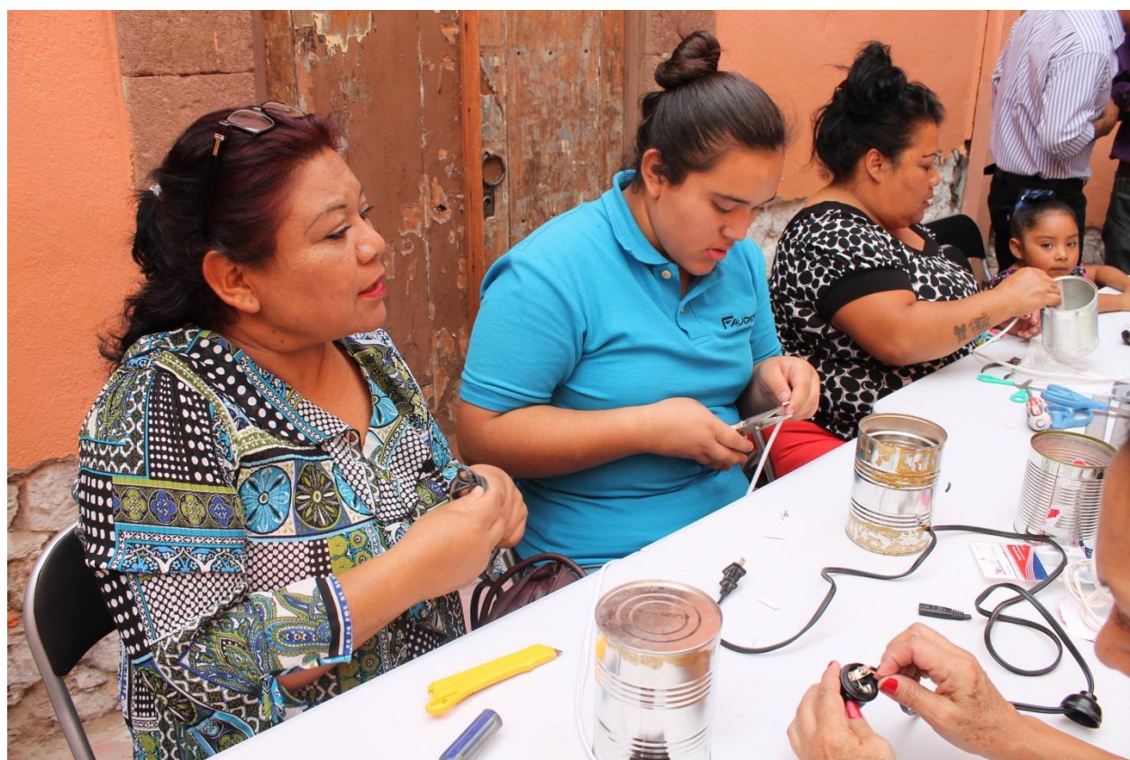
Talleres de autoempleo a beneficiarias de la institución. Taller de elaboración de lámparas. 2018