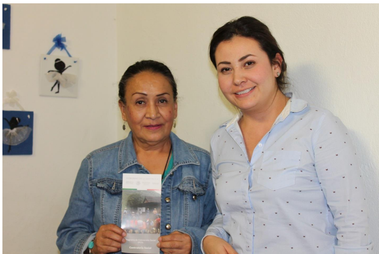
Unidad de Reinserción con beneficiaria, madre de beneficiario de defensa jurídica. Vinculación de contraloría social en proyectos sociales de la institución. 2018.