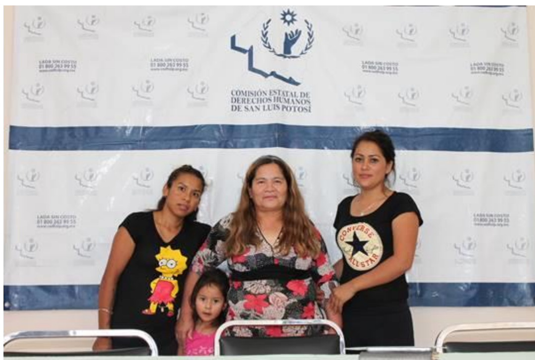
Defensa jurídica, obteniendo la libertad de una de nuestras beneficiarias, en colaboración con la Comisión Estatal de Derechos Humanos de San Luis Potosí. 2018