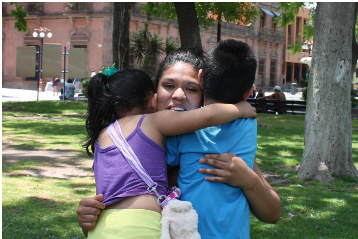
Libertad a beneficiaria, bajo defensa jurídica de Renace. Reunión con su hija e hijo. 2017.