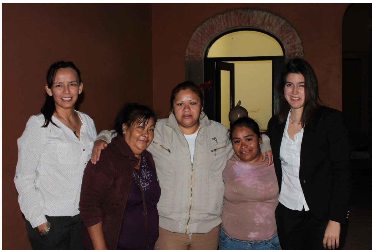
Libertad a beneficiaria, bajo defensa jurídica de Renace. Reunión con su familia y Equipo Renace. 2017