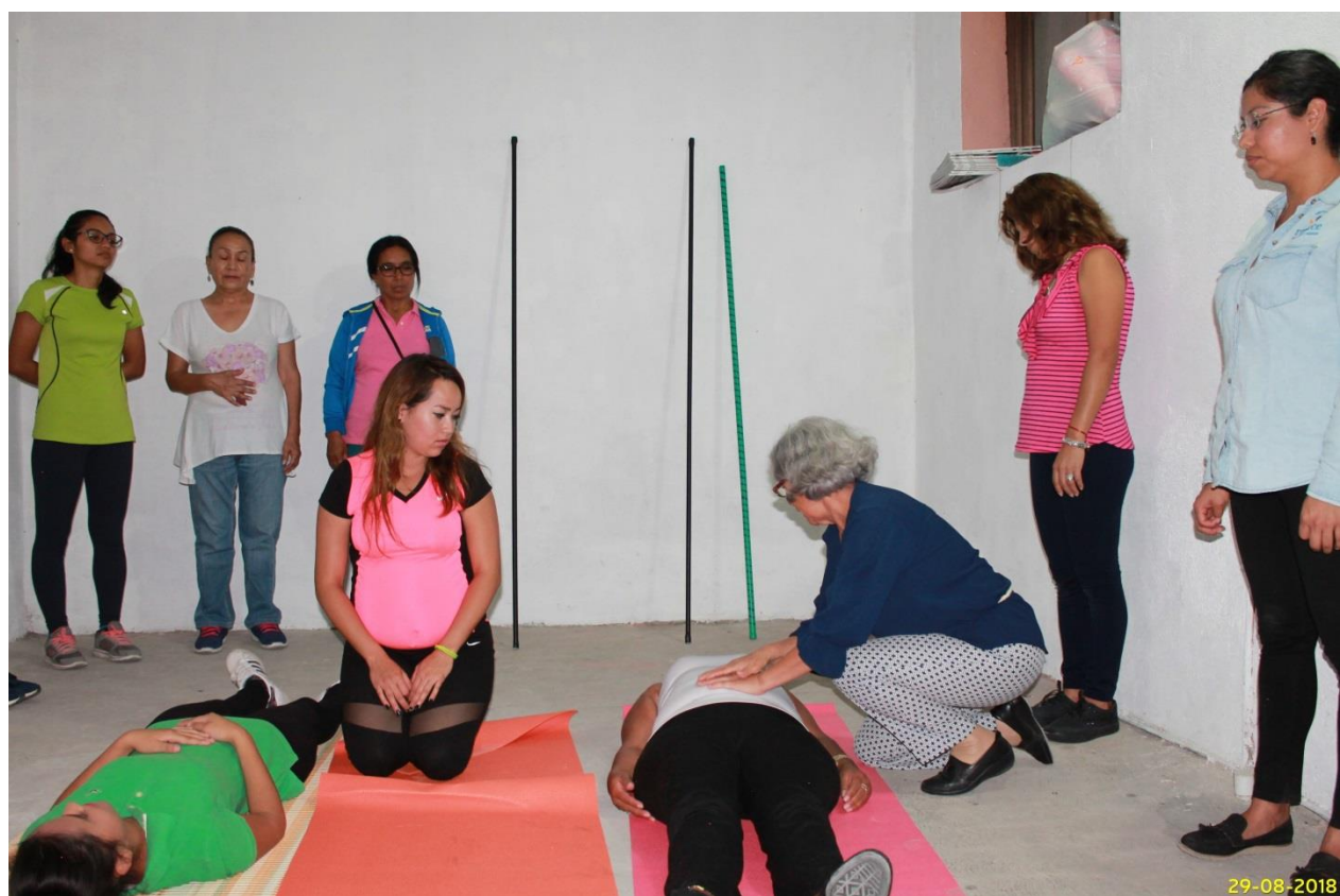
Talleres de autoempleo a beneficiarias de la institución. Taller de yoga terapéutica. 2018