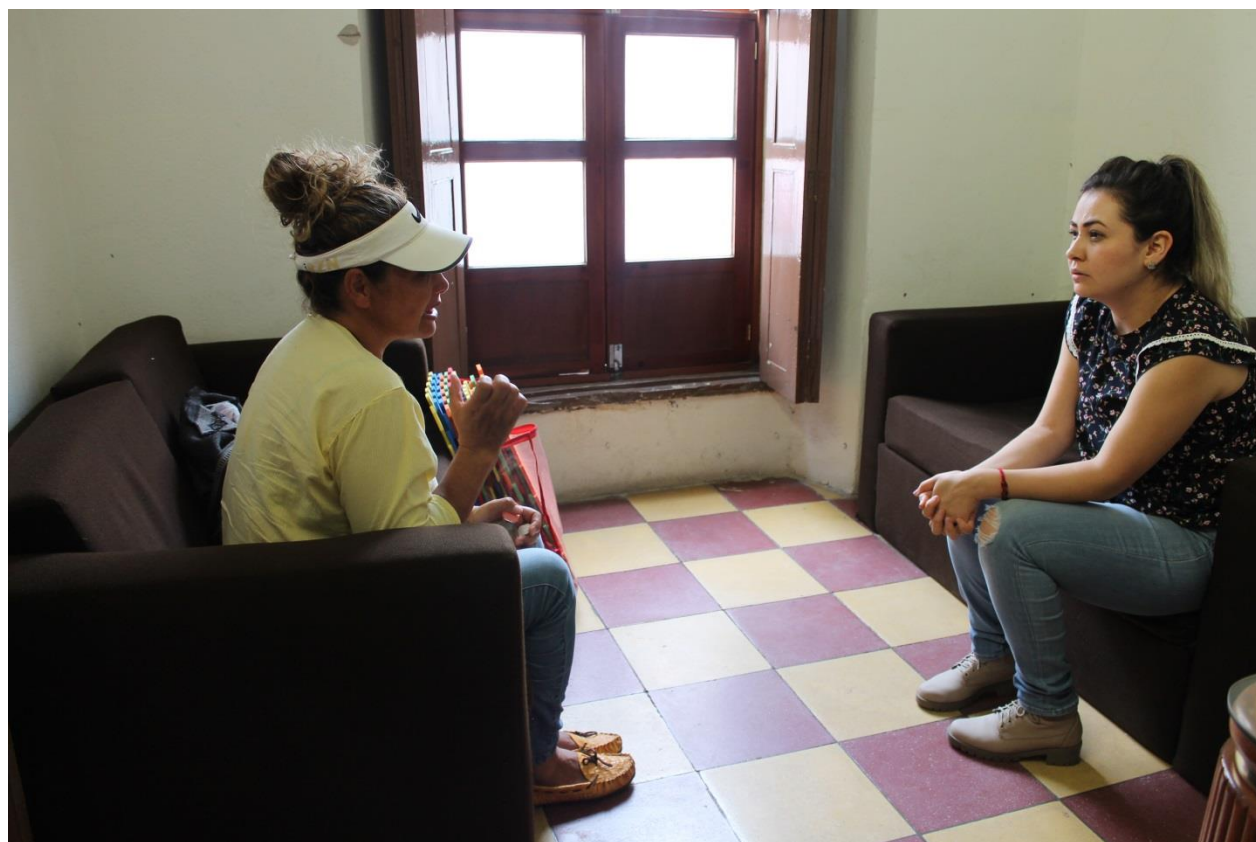
Unidad de Reinserción de Renace realizando terapia familiar a beneficiaria, quien es madre de un joven defendido por la Unidad Jurídica. 2018