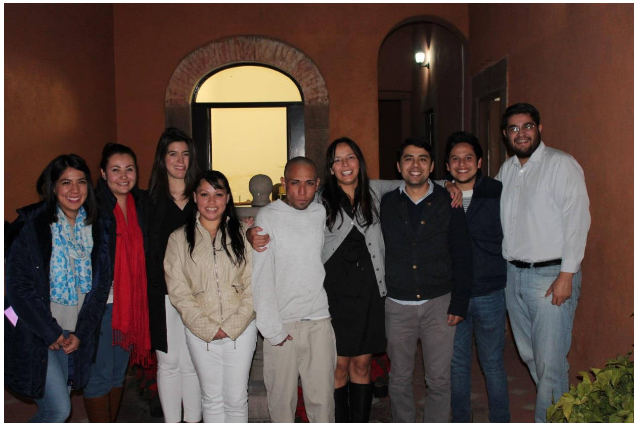
Libertad a beneficiaria, bajo defensa jurídica de Renace. Reunión con su familia y equipo Renace. 2017