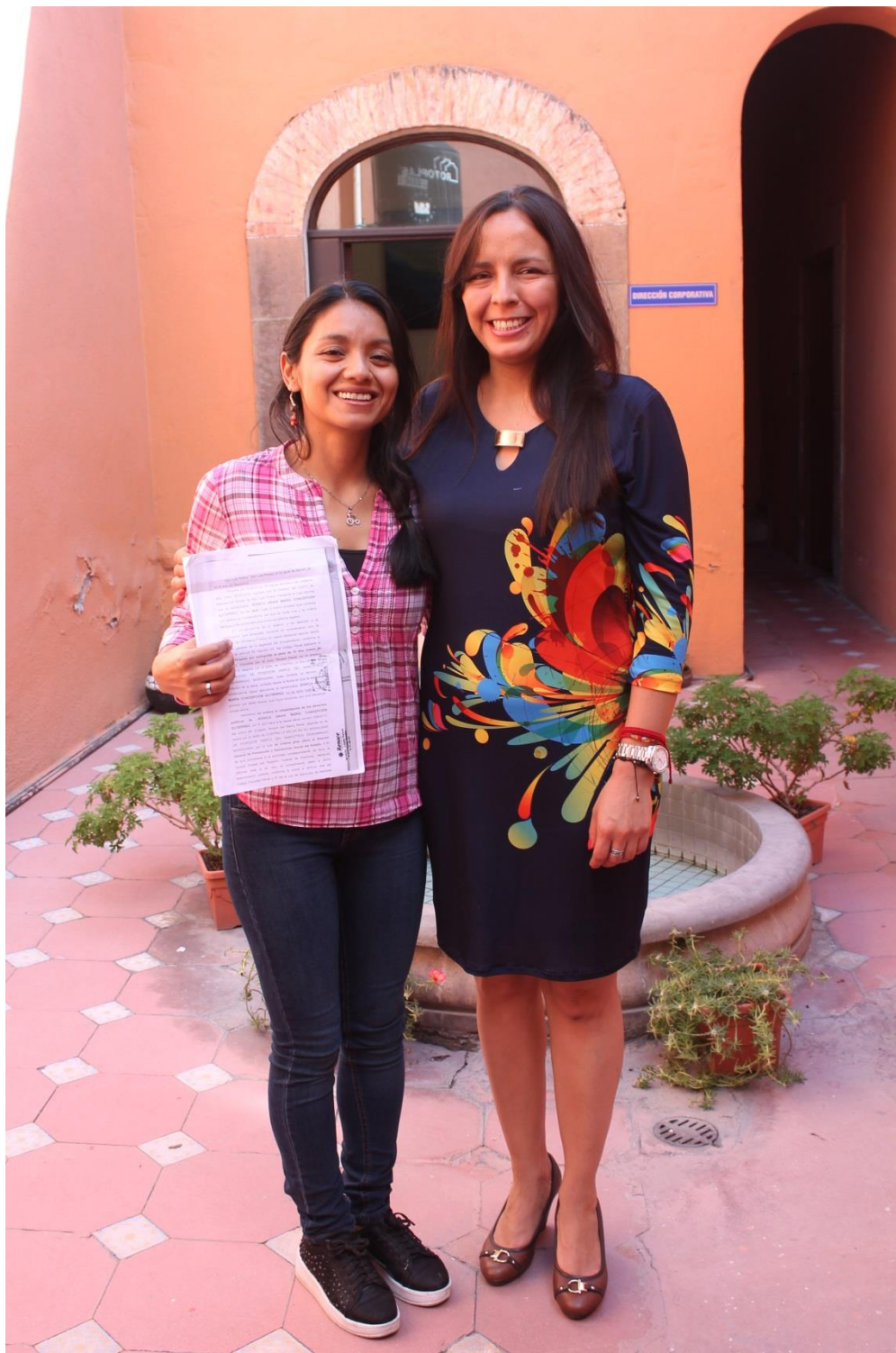
Unidad Jurídica de Renace notificando su libertad a una de nuestras beneficiarias. 2018