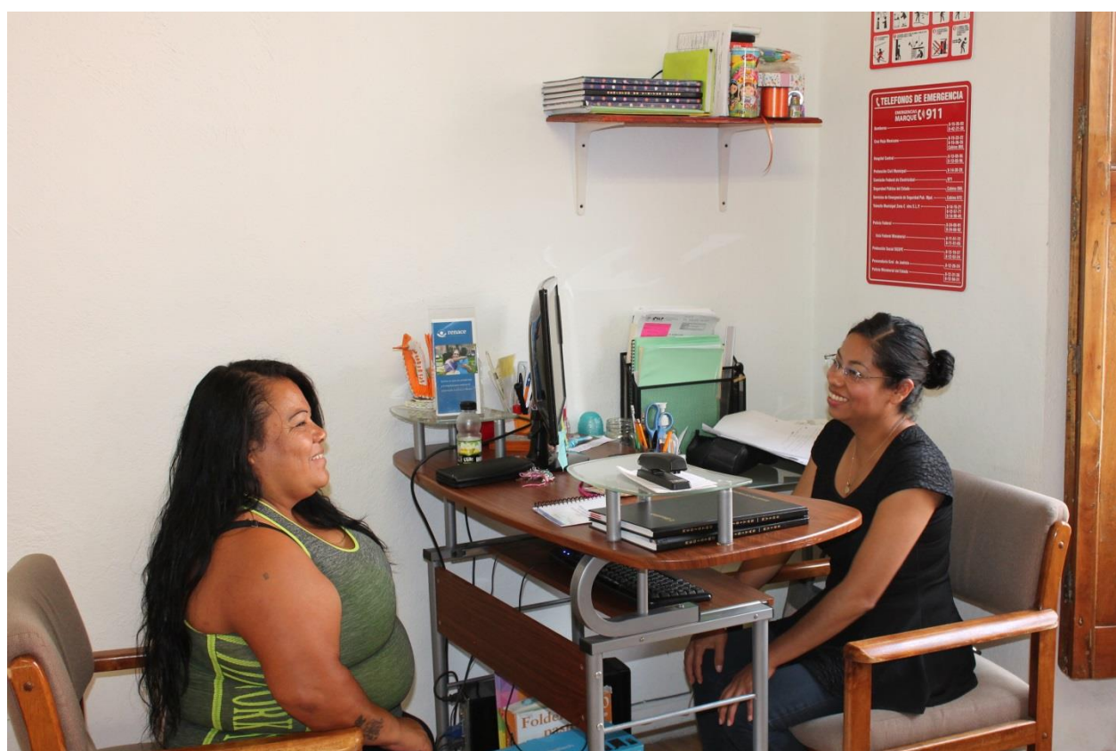
Unidad de Control y Vigilancia agendando citas de vinculación laboral y seguimiento académico con beneficiaria. 2018