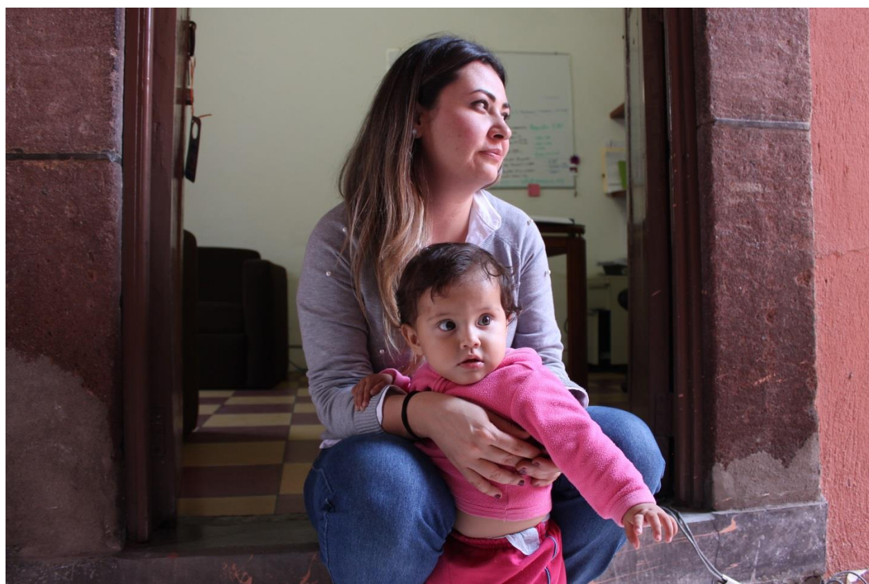
Unidad de Reinserción de Renace en una dinámica con hijas e hijos de beneficiarias de defensa jurídica. 2018